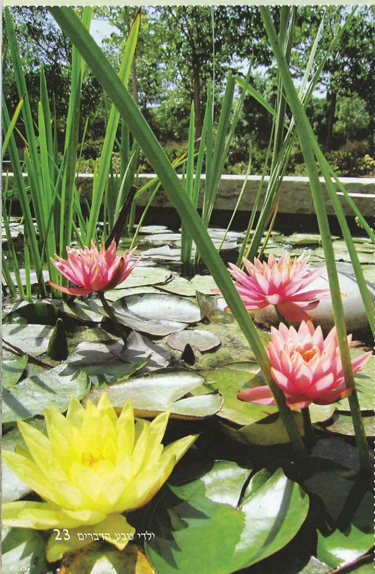
ילדי טבע הדברים 23