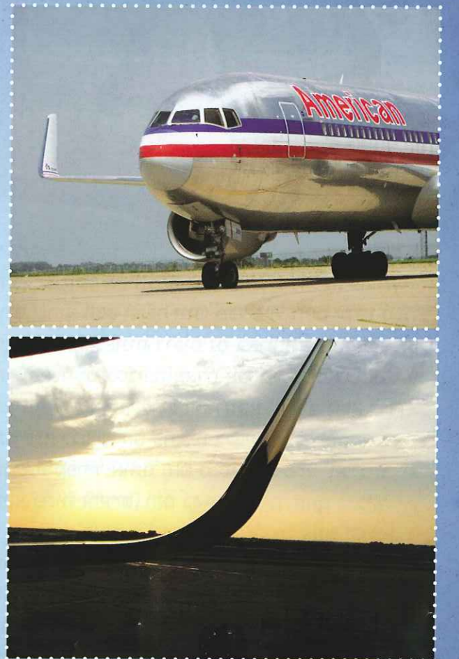
כדי לייצב את המטוס באוויר בזמן טיסה, כופפו את קצות הכנפיים בדומה לכנפי העופות.

כתבו וצילמו: ד"ר סלעית רזן בשילוב קטעי הסבר (בצבע כחול) מתוך אתר החינוך של רמת הנדיב ואתר ארגון הביומימיקרי הישראלי