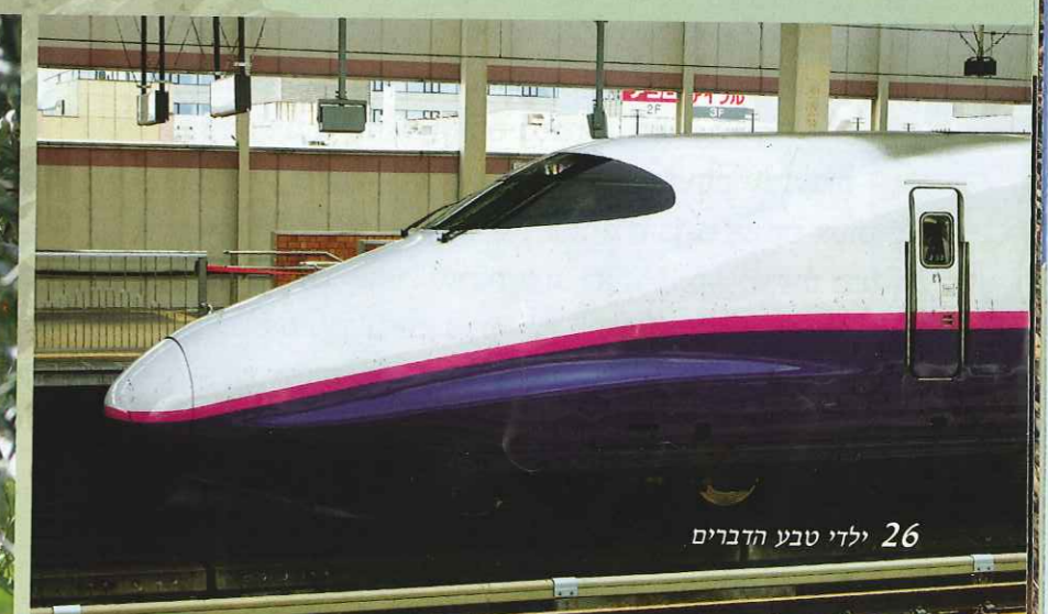
26 ילדי טבע הדברים