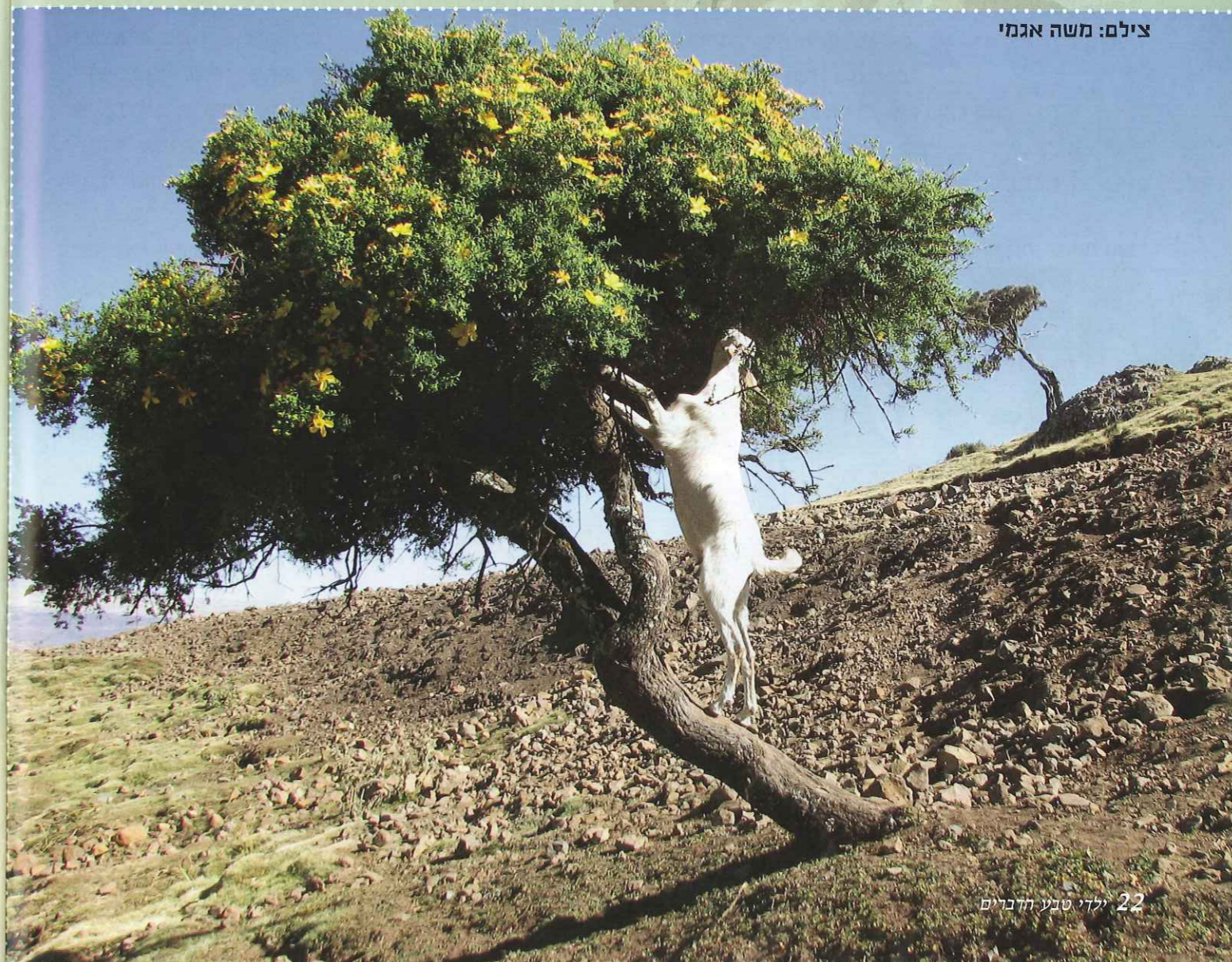
22 ילדי טבע הדברים